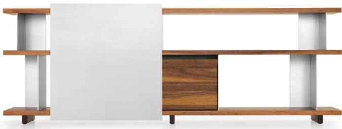
Type 4 - 1x Element 22, 1x Element 33